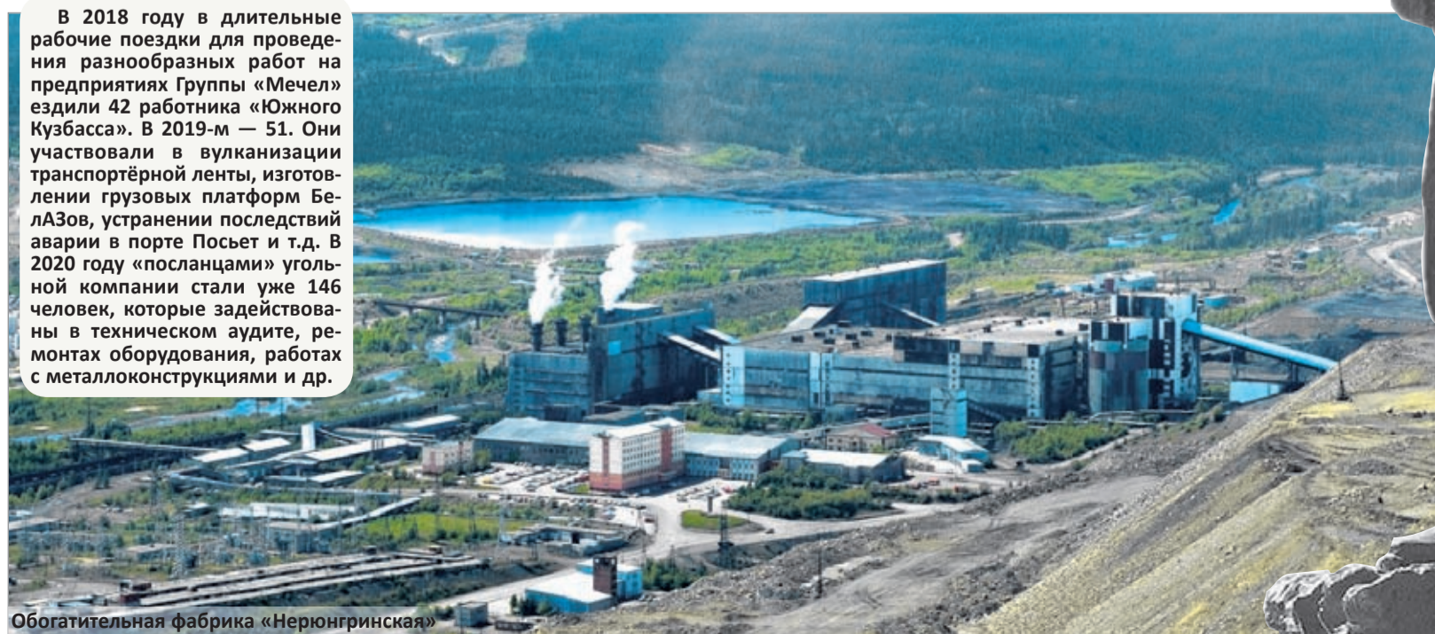
Обогатительная фабрика «Нерюнгринская»

В 2018 году в длительные рабочие поездки для проведения разнообразных работ на предприятиях Группы «Мечел» ездили 42 работника «Южного Кузбасса». В 2019-м — 51. Они участвовали в вулканизации транспортёрной ленты, изготовлении грузовых платформ БелАЗов, устранении последствий аварии в порте Посьет и т.д. В 2020 году «посланцами» угольной компании стали уже 146 человек, которые задействованы в техническом аудите, ремонтах оборудования, работах с металлоконструкциями и др.