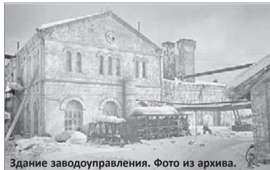
Здание заводоуправления.

НЕОБЫЧНАЯ ИСТОРИЯ ВЯРТСИЛЬСКОГО ЗАВОДА НАСЧИТЫВАЕТ 170 ЛЕТ