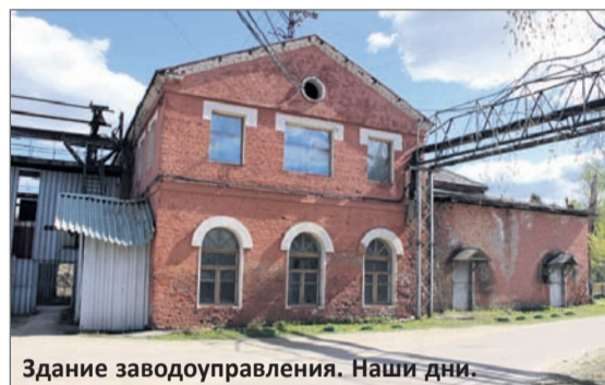
Здание заводоуправления. Наши дни.