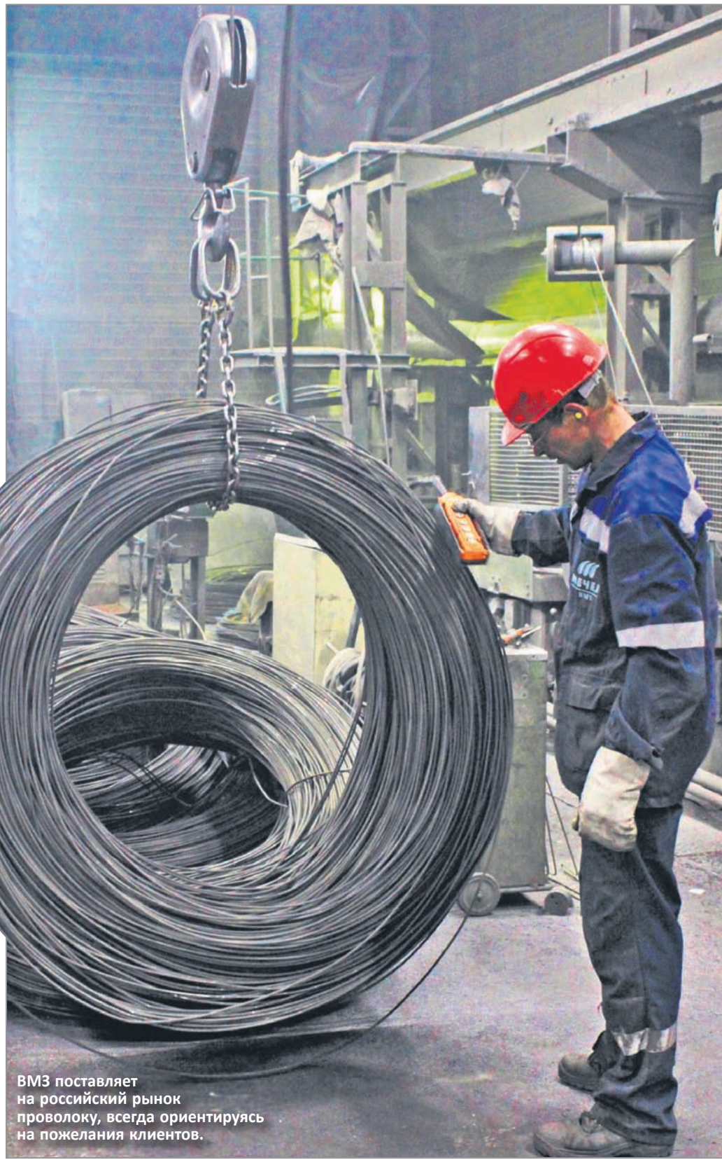
ВМЗ поставляет на российский рынок проволоку, всегда ориентируясь на пожелания клиентов.

На сегодняшний день численность работников — чуть больше 200 человек, а всего в Вяртсילה проживает около 2900 человек. Мал золотник, в народе говорят, да дорог. Как нельзя лучше подходит к Вяртсильскому заводу.