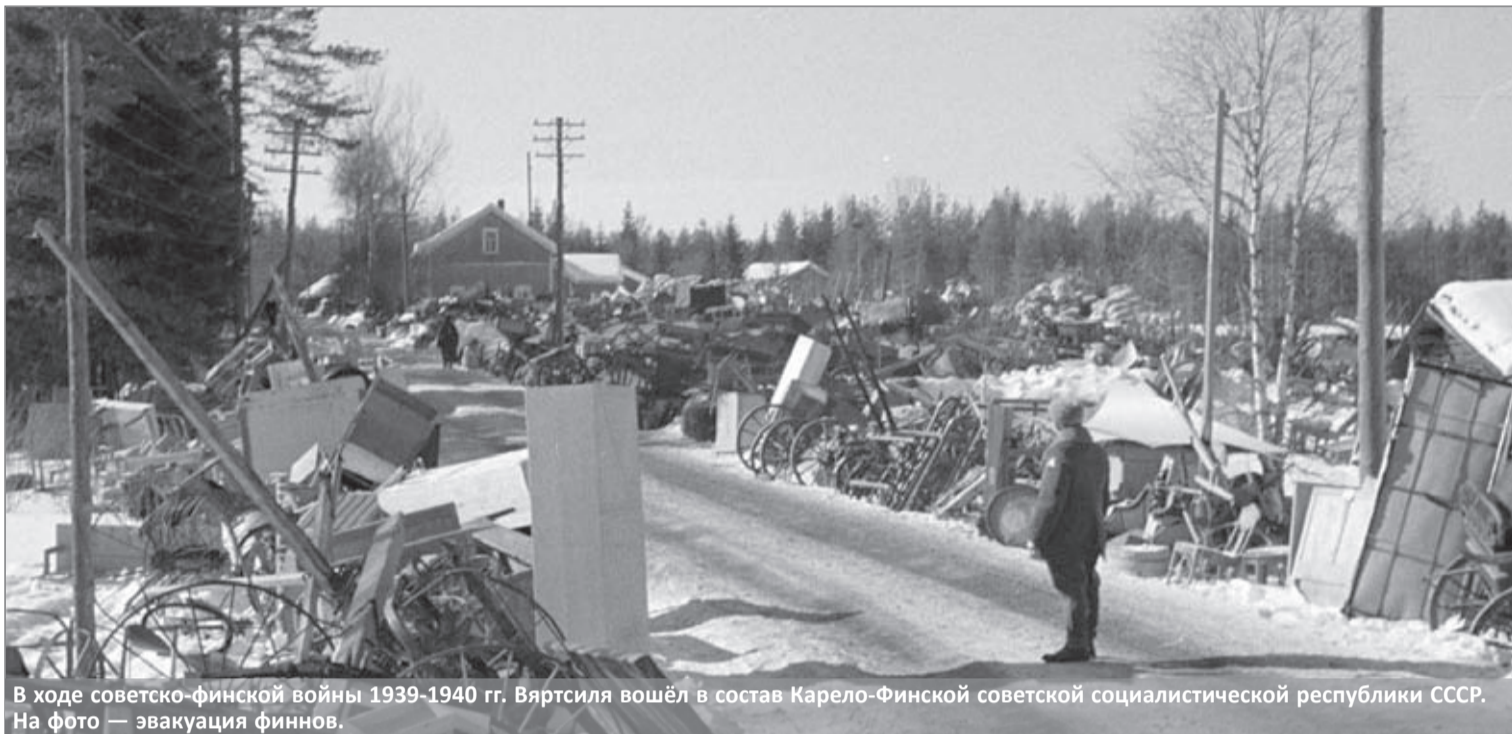
В ходе советско-финской войны 1939-1940 гг. Вяртсиля вошёл в состав Карело-Финской советской социалистической республики СССР. На фото — эвакуация финнов.

Вяртсильский метизный (ранее — металлургический) завод (ВМЗ) действует на территории посёлка Вяртсиля республики Карелия с 20 ноября 1850 года.